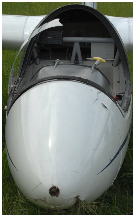
6, 7 i 8 – Uszkodzenia przedniej części kadłuba szybowca pokazane na zbliżeniach.