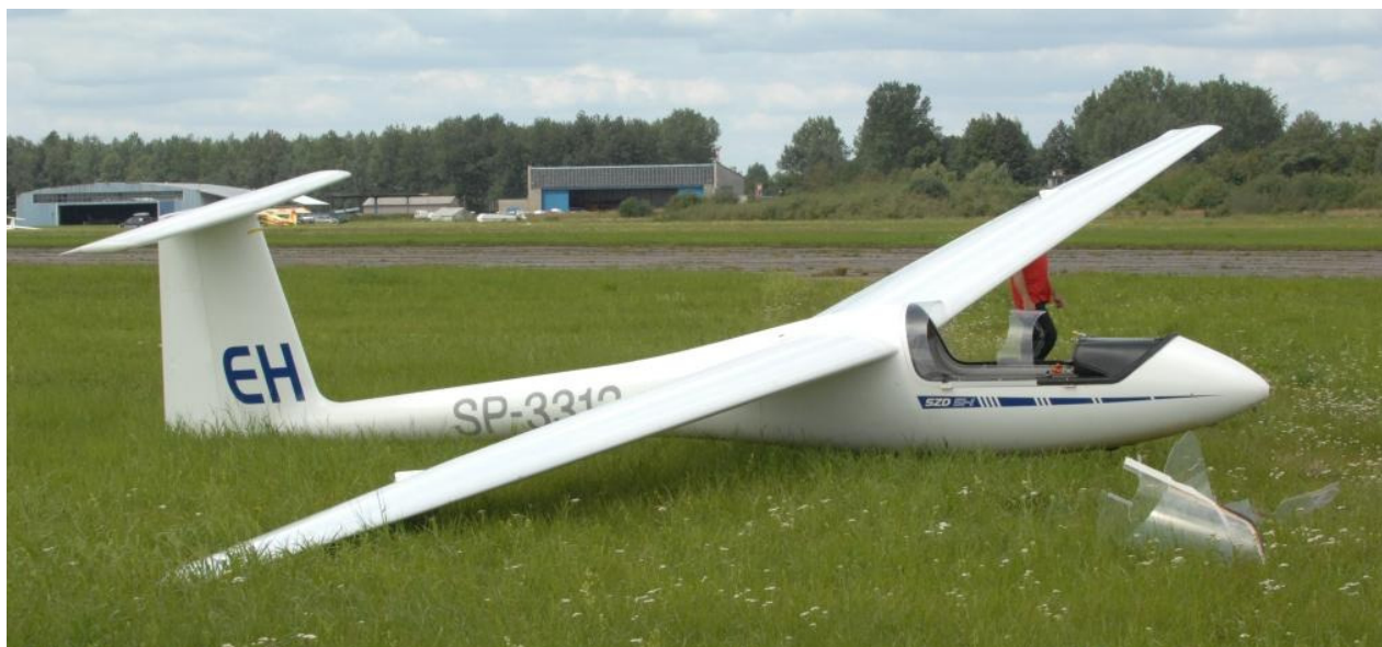
2 – Ogólny widok szybowca na miejscu wypadku. Widoczne potłuczone oszklenie osłony kabiny.