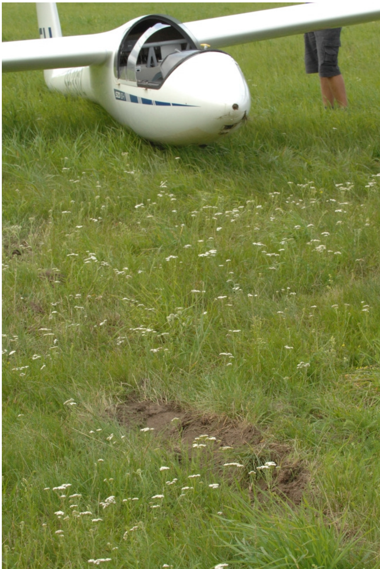
5 – Ślad przyziemienia szybowca na miejscu wypadku.