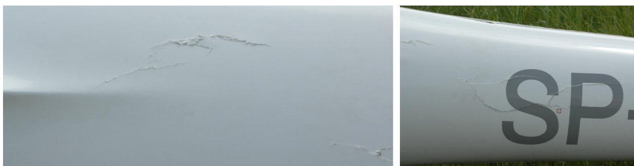
11 i 12 – Uszkodzenia (pęknięcia) skorupy na lewym boku belki ogonowej za skrzydłem szybowca.