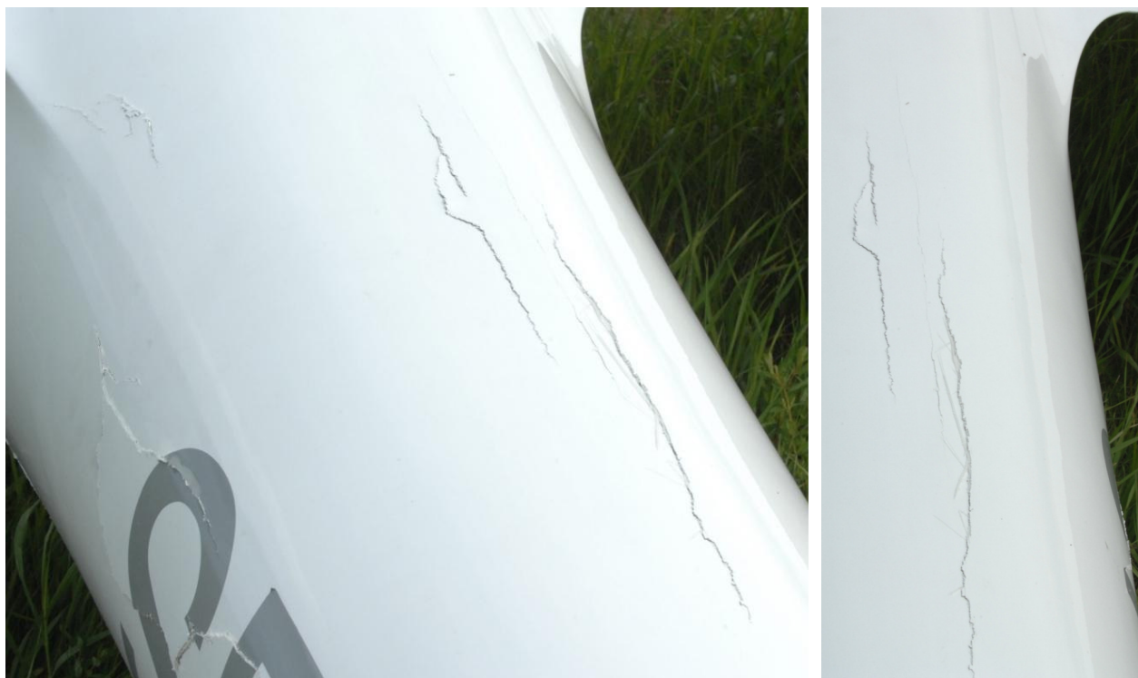
9 i 10 – Uszkodzenia (pęknięcia) skorupy grzbietu belki ogonowej za skrzydłem szybowca.